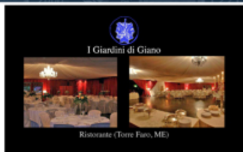
I Giardini di Giano