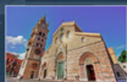
DUOMO DI MESSINA

GIORNATA COMMEMORATIVA 13 Maggio 2012, ore 11:00